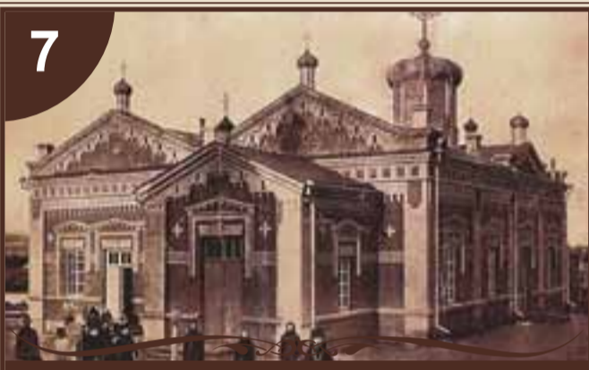
ЦЕРКВА СВЯТОЇ ТРІЙЦІ

Балтщина була і залишається багатонаціональним краєм. Тут проживають представники 13 національностей. Етнос нашого міста формувався декілька століть... В першій половині XVIII століття на правому березі річки Кодими, в турецькій спободі Балта, почали селитися старообрядці, вихідці з Чернігівської області. Спочатку вони спорудили дерев'яну часовню в ім'я святого Макарія, а з часом кам'яну церкву в ім'я Успення Пресвятої Богородиці, яка діє і в наш час. Також тут працювало декілька молитвенних будинків. Проживали старообрядці компактно, хоча вирізнялися двома головними течіями старообрядництва: поповщина та безпоповщина. Сім'ї, які належали до різних течій, селилися на окремих вулицях. Так виникли в нашому місті вулиці Нижня Руська, Середня Руська, Верхня Руська. Швидке збагачення балтських старообрядців висунуло їх на видне місце, що привело до заснування однієї з перших в Росії Балтської єпархії.