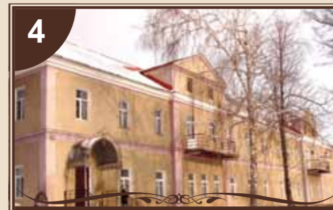
ПАЛАЦ КНЯЗІВ ЛЮБОМИРСЬКИХ

В часи, коли зводилися будівлі польської фортеці Юзефград, були збудовані підземні ходи. Це сітка підземних ходів, що брали початок від вірменокатолицького костелу Святого Станіслава і розгалужувалися по території містечка Юзефграда та, проходячи під річкою Кодимкою, виходили на територію турецької спободи Балта. Ходи викладені червоною цеглою. Вони мають висоту до 2,5 та ширину до 3,5 метра. Між ходами зустрічаються великі підземні зали. Підземні ходи мали велике оборонне значення. Під час нападу ворога жителі мали можливість переховуватися в них. З часом мешканці міста використовували їх для зберігання риби, овочів, зробивши проходи зі своїх домів. В даний час ведуться роботи по вивченню схеми ходів спеціалістами Одеського університету ім. І.І.Мечнікова та можливості відкриття їх для відвідувачів.