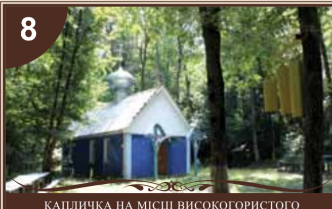
КАПЛИЧКА НА МІСЦІ ВИСОКОГОРИСТОГО УСПЕНСЬКОГО ЧОЛОВІЧОГО МОНАСТІРЯ