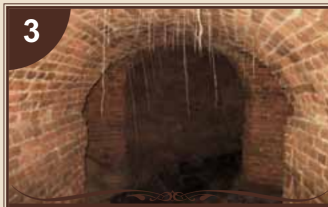
ФРАГМЕНТ ПІДЗЕМНИХ ХОДІВ

Символ міста – пожежна каланча. На залишках колишнього замку Любомирських протягом 1924-1925 років будується пожежна частина та пожежна каланча. Проектну документацію виготовив професор Малиновський. В архітектурі зустрічаються стилі раннього конструктивізму та класицизму. Роботу виконувала група одеських бетонників. Глибина фундаменту сім метрів, а висота каланчі – 27 метрів. На фундаменті пішло бетону у десять разів більше, ніж на саму конструкцію. Тут налічується 117 сходинок, 12 бетонних майданчиків. На каланчі в довоєнний час були встановлені 4 годинники, але в роки війни їх зняли. Підніміться на оглядовий майданчик каланчі і перед вами відкриється панорама Балти, яка потопала в зелені дерев, садків, а в зимовий час проглядаються всі вулиці міста. Пожежна каланча є пам'яткою архітектури.