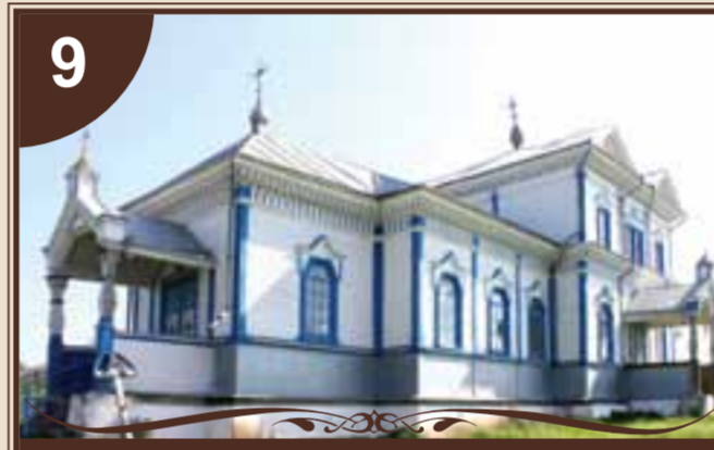
ЦЕРКВА РІЗДВА ПРЕСВЯТОЇ БОГОРОДИЦІ