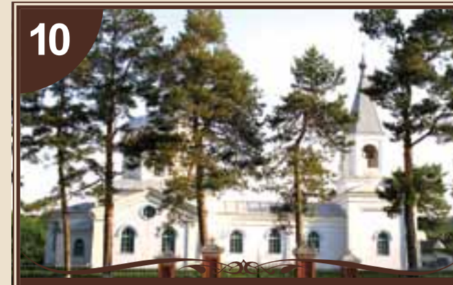
ЦЕРКВА В ІМ'Я ПОКРОВИ ПРЕСВЯТОЇ БОГОРОДИЦІ

В центрі села Обжиле розташована дерев'яна церква Різдва Пресвятої Богородиці, заснована в 1888 році та побудована в 1901 році. Вартість будівництва – 16000 рублів. Під час спорудження храму богослужіння відбувалося в тимчасовій церкві, збудованій в 1887 році. Важка доля випала храмам, що функціонували в кожному населеному пункті Балтщини в XX столітті. Більшість із них були закриті або зруйновані. Чудодійні ікони, іконостаси, виготовлені народними умільцями, вивозилися, спалювалися, а церковне майно розрабовувалося. Така доля дісталася і Обжилівській церкві, яка була закрита, перетворена під склад. В даний час церква відновлена, це найкращий пам'ятник дерев'яного зодчества.