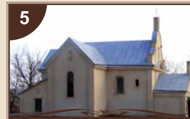
КОСТЬОЛ СВ. СТАНІСЛАВА

В центрі старого міста, колишнього Юзефграду, на самому високому пагорбі, височить маєток польського магната Юзефа Любомирського... 24 листопада 1738 р. синові князя Юрія Любомирського Юзефу переходять південні володіння батька, в тому числі й поселення Паліве Озеро. Син продовжує розпочате батьком будівництво фортечних споруд з маєтком. Відтоді починає відлік часу містечку Юзефград, назване в честь його засновника Юзефа Любомирського. Загальною рисою всіх будівель є те, що вони мають товщину понад один метр, його зводів. Маєток слугував резиденцією сім'ї Любомирських, а в даний час потопала в зелені ялин, різнобарв'я квітів та молодих голосів – студентів педагогічного училища, відкритого у 1930 році як укрпедшкола. Тут ви можете відвідати музей, експонати якого розповідають про історію навчального закладу, відпочити в тіні дерев, помилуватися фонтанами.