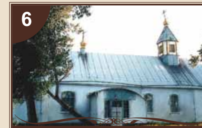
ЦЕРКВА В ІМ'Я УСПЕННЯ ПРЕСВЯТОЇ БОГОРОДИЦІ

У 1765 році Юзеф Любомирський видає указ про будівництво в Юзефграді вірмено-католицького костьолу, що носило ім'я Святого Станіслава Краковського, єпископа-мученика. Костьол, а також палац, будувався під керівництвом скульптора та архітектора Себастьяна Фісенгера. Першим настоятелем святини став випускник Львівського колегіуму отець Радецький. Олександром, сином князя Юзефа Любомирського, була проведена реконструкція костелу і встановлено орган. У 1826 році єпископ Кам'янець-Подільський освятив його як римо-католицький. Протягом XIX ст. костьол підтримувала місцева еліта – нащадки польських аристократичних родин. У 1930 р. храм закрили і тільки у 1993 р. костьол св. Станіслава освятив єпископ Кам'янець-Подільський дєєзєє Ян Ольшанський. У 2015 році споруду вірмено-католицького костьолу Святого Станіслава виповниться 250 років.